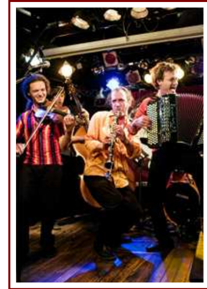
Le Tram des Balkans